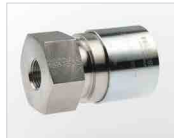
Fitting mit Innengewinde