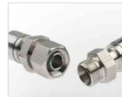
DKO 24° Fitting