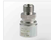
Fitting mit Aussengewinde